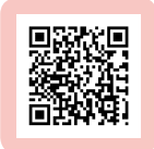
支持勵馨 勇敢做自己

因經費短缺需要籌措資源，曾擔心疫情的影響限縮了捐款人的捐款意願，但感謝在防疫期間繼續支持的愛馨人與愛馨企業，協助勵馨打造婦女的自立家園。